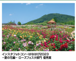
インスタフォトコンはなび2023 夏の花編—ローズフェスタ部門 優秀賞

期間中に園内で撮影した写真をインスタグラムに投稿しよう! 世羅高原農場広報室アカウント @serakogen_staff をフォローして2つのハッシュタグ#hanahapi2023と#世羅高原花の森ローズフェスタ2023をつけて応募するだけ! ■応募期間: 2023年5月20日(土)~9月10日(日) 入賞者にはプレゼント☆